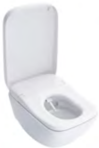
NEOREST® WX1 WC mit integriertem WASHLET®

Dabei wurden weder Kompromisse zu Lasten des Designs noch zu Lasten der Technologien gemacht. Die Technik wird von der Keramik eingefasst, so dass die vielen besonderen Funktionen des NEOREST® WX von außen nicht sichtbar sind.