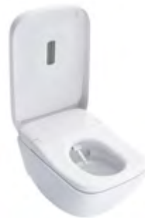
NEOREST® WX2 WC mit integriertem WASHLET®

Farbe: Weiß Maße: 444 × 660 × 367 mm Artikel: CW927PZY